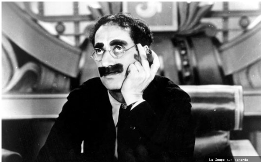
La Soupe aux canards